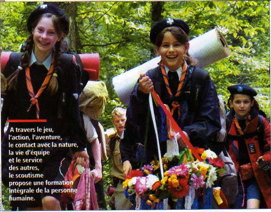
SCOUTS UNITAIRES DE FRANCE

A travers le jeu, l'action, l'aventure, le contact avec la nature, la vie d'équipe et le service des autres, le scoutisme propose une formation intégrale de la personne humaine.