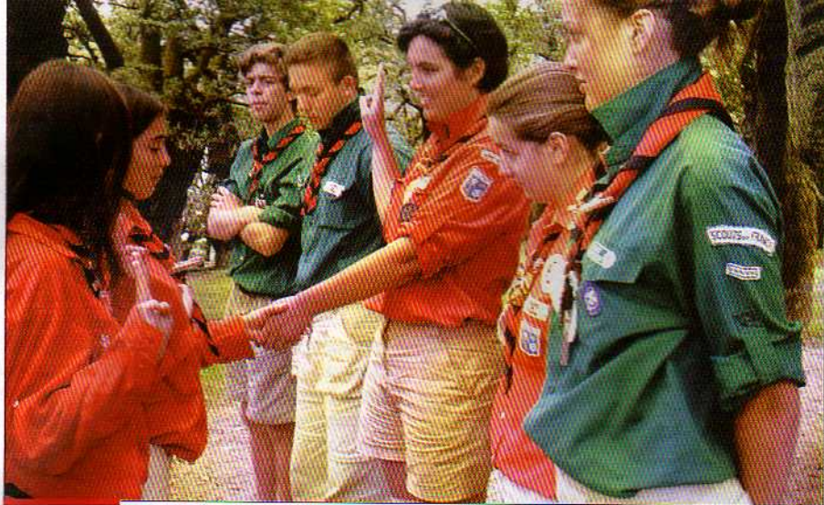
SCOUTS ET GUIDES DE FRANCE

« La promesse et la prière scoutesses constituent une base et un idéal à développer tout au long de l'existence. [...] Lorsque l'homme s'efforce d'être fidèle à ses promesses, le Seigneur lui-même affermit ses pas. » Message du Pape Benoît XVI à l'occasion du centenaire du scoutisme.